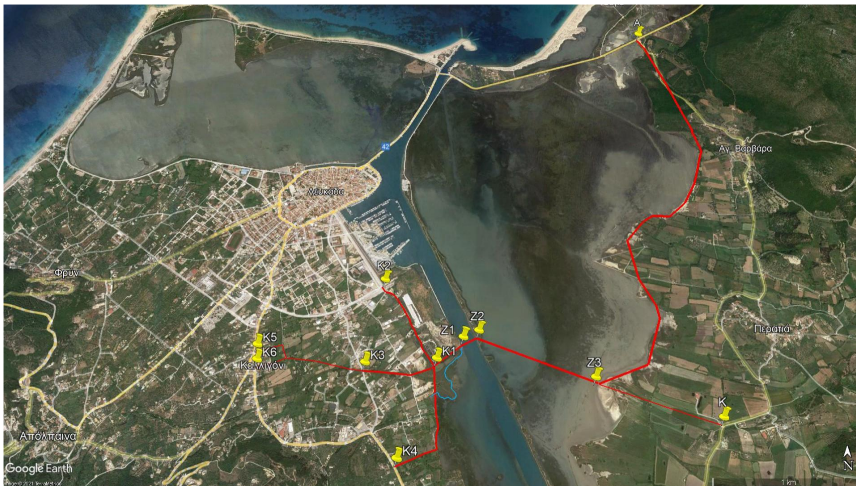
Εικ. 4. Προτεινόμενη Λύση: Οδευση στην ανατολική ακτή, ή, εν μέρει, σε επίχωμα εντός της λιμνοθάλασσας του Αβλέμονα, παραπλεύρως της ακτής. Πλωτή ανοιγόμενη γέφυρα στα σημεία Z1-Z2 (ή υποθαλάσσια ζεύξη, υπό προϋποθέσεις) που διέρχεται από τα σημεία Z1-Z2 ή εγγύς αυτών. Τελικό τμήμα Z2-Z3 χαμηλή γέφυρα μήκους 600-900 μ εντός Αβλέμονα με καλαισθητα ρωμαϊκά τόξα (καμάρες, όπως το οθωμανικό υδραγωγείο της Αγ. Μαύρας) σε χαλικοπασσάλους. 6 κόμβοι για τη κατανομή, μερισμό και διάχυση της κυκλοφορίας εντός της νήσου Λευκάδας, K1-K6. K2: Κόμβος με οδό Φιλοσόφων. Έξοδος προς Περαιτιά, Έξοδος προς Πλαγιά – Πογωνιά – Πάλαιρο (Κόμβος K).