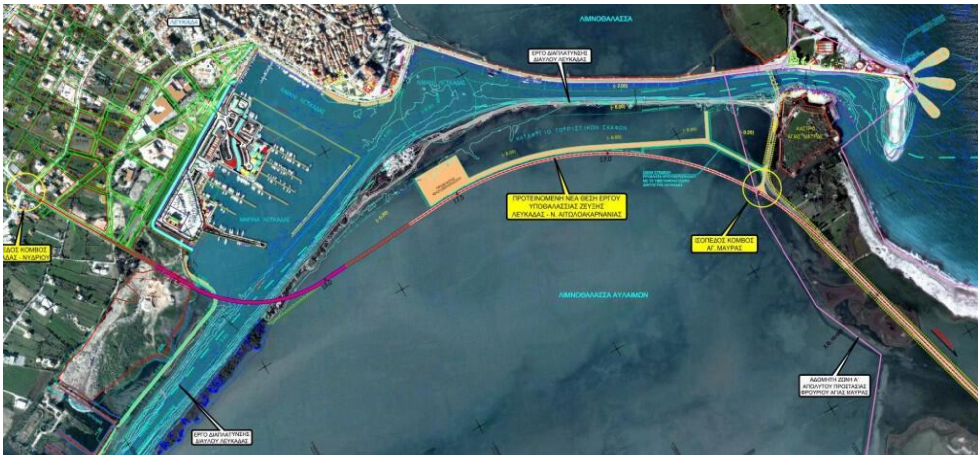
Εικ. 1. Πρωτεύουσα λύση, όπως εμφανίζεται στα μέσα πληροφόρησης.